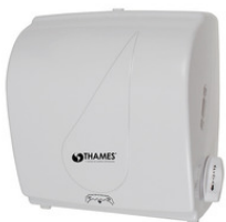
DISP. BOBINA AUTO-CUT LINEA GOTA ABS Blanco, Fumé P/bobinas de 200mts HACCP