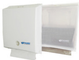
DISP. TOALLAS INTERCALADAS PVC Blanco, Transparente

Convertimos diferentes productos de papel tissue, asegurando seguridad, calidad y los mejores precios del mercado.