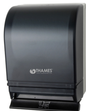
DISP. BOBINA C/BARRA CENTRAL ABS Blanco, Fumé P/bobinas de 200mts.