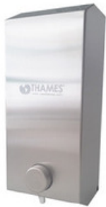
ACERO Acero inox Satinado 900ml