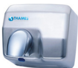
STORM Acero inoxidable con acabado satén. Sensor infrarrojo: funciona sólo cuando capta movimiento. Tolla gira 360°. Secado de manos en 10-15 segundos. Potencia: 2500w