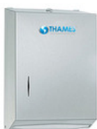
DISP. TOALLAS INTERCALADAS Acero inox. Satinado