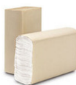
TOALLAS INTERCALADAS Amplia gama de calidades y medidas. 20cm x 24cm aprox. (4 pliegos - cortas) 20cm x 37cm aprox. (6 pliegos - largas) 10 ladrillos de 250 toallas REALES