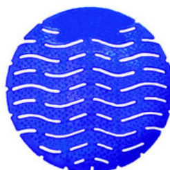
GREENLINE Rejilla desodorizadora de mingitorios. Perfuma baños gracias a su agradable fragancia de alta duración.