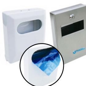
DISP. BOLSITAS FEMENINAS Dispenser de bolsas para desechos de apósitos femeninos. PVC y Acero inox satinado Recargas: Bolsitas con cierre adhesivo x 100 u.