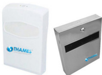
DISP. PAPEL CUBRE INODORO Elimina la desprolijidad y los desperdicios generados por los improvisados cobertores hechos con papel higiénico. PVC y Acero inox satinado Recargas: papel cubre inodoro x 200 u.