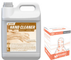
HAND CLEANER Jabón cosmético Mango, Manzana, Tropical, Sweet Vanillia Bidón x 5lts. 800ml bag in box (líquido) 800ml bag in box (espuma)

Amplia gama de productos y presentaciones para una correcta higiene de manos.