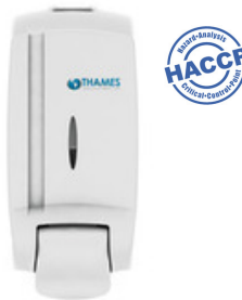
ESPUMA BAG IN BOX ABS Blanco 800ml