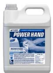
POWER HAND Jabón desengrasante Sin fragancia Bidón x 5lts.