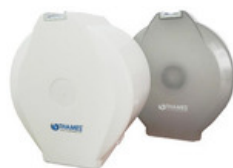
DISP. PAPEL HIGIÉNICO PVC Blanco y Fumé P/rollos de 200 y 300mts