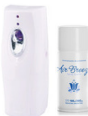
AROMATIZADOR PROGRAMABLE Dispensa un disparo de exclusiva fragancia en intervalos dispuestos por el usuario. Funciona a pila. Recarga: Aromatizadores Air Breeze.