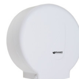
DISP. PAPEL HIGIÉNICO LINEA GOTA PP Blanco P/rollos de 200 y 300mts