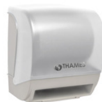
DISP. BOBINA C/SENSOR ABS Blanco P/bobinas de 200mts. Funciona a pilas.