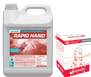
RAPID HAND Jabón antibacterial Sin fragancia Bidón x 5lts. 800ml bag in box (líquido) 800ml bag in box (espuma) Aprobado por SENASA y ANMAT