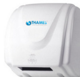
FENIX Carcasa metálica blanca. Sensor infrarrojo: funciona sólo cuando capta movimiento. Secado de manos en 30 segundos. Potencia: 1800w