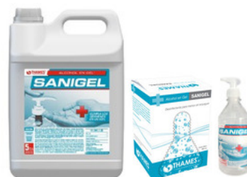
SANIGEL Alcohol en gel Sin fragancia Bidón x 5lts. 800ml bag in box (líquido) 500ml botella con dosificador Aprobado por SENASA y ANMAT