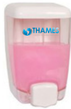
BULKY PVC/Acrílico Blanco 1000ml