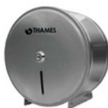
DISP. PAPEL HIGIÉNICO Acero inox. Satinado P/rollos de 200 y 300mts